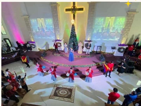
↑インドネシアの教会でクリスマスをお祝いする様子

イスラム教徒が多数を占めるインドネシアですが、約10%程度キリスト教徒が存在し、クリスマスは国民の祝日として広く認められています！また、インドネシアでは25日と26日にクリスマスを祝います。インドネシアでは、宗教的な多様性を尊重し、異なる文化の祝日も共に祝う文化が根付いているそうです☺