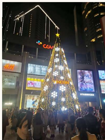
↑ベトナムのクリスマスの街並みとても華やかで写真映える場所がたくさんあります💎

ベトナムではクリスマスは主に若者たちのイベントとして楽しまれています！家族と過ごす人もいますが、どちらかというと恋人と過ごす日というイメージが強く、クリスマスの飾りつけがされた街に若者たちが繰り出して賑わうそうです♥ クリスマスの食事は日本と大きな違いはなく、チキンやケーキ、ピザなどを食べる人が多いとのこと。 クリスマスが終わると日本ではお正月の準備に入りますが、旧正月文化のベトナムではテトまでまだ少し時間があるので、12月25日を過ぎてもすぐにクリスマスの飾りを撤去することなくテトの飾りつけが始まる時期までそのままにすることも珍しくないそうです☺